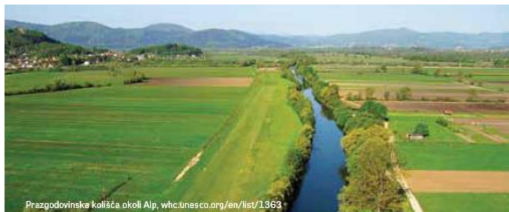
Prazgodovinska kolišča okoli Alp, whc.unesco.org/en/list/1363