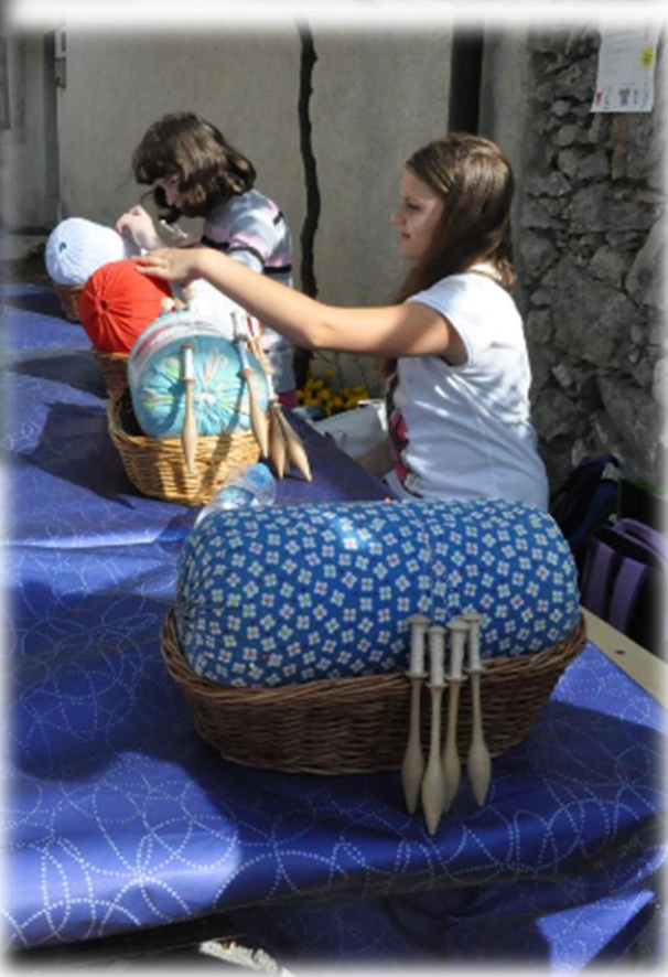
Štanjel, odprtje DEKD in TKD 2016