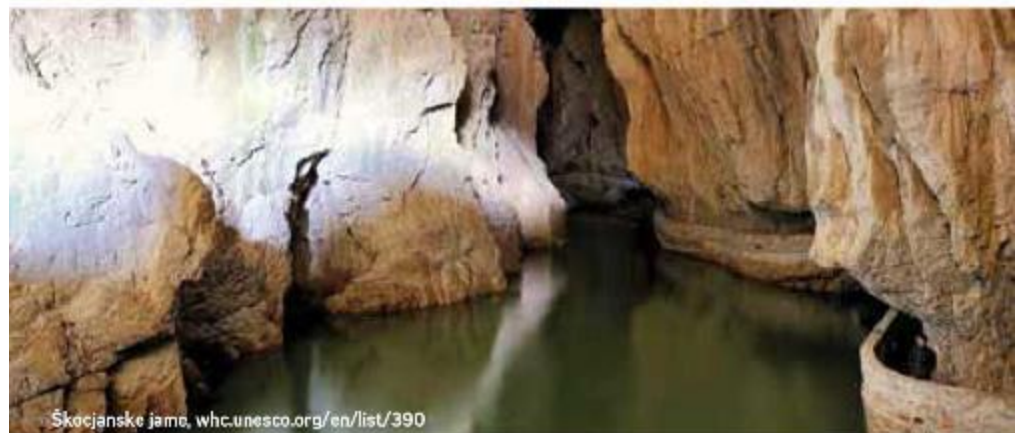
Škocjanske jame, whc.unesco.org/en/list/390