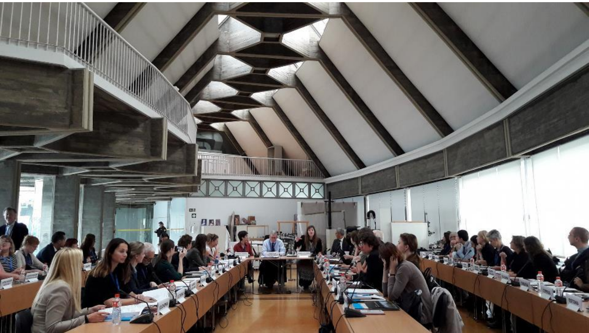
Plenarno zasedanje DEKD, oktober 2016, Madrid