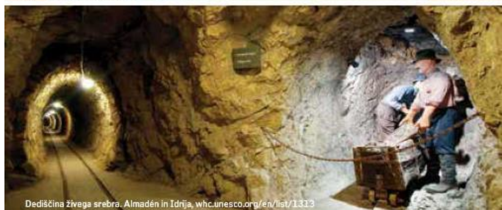
Dediščina živega srebra. Almadén in Idríja, whc.unesco.org/en/list/1313