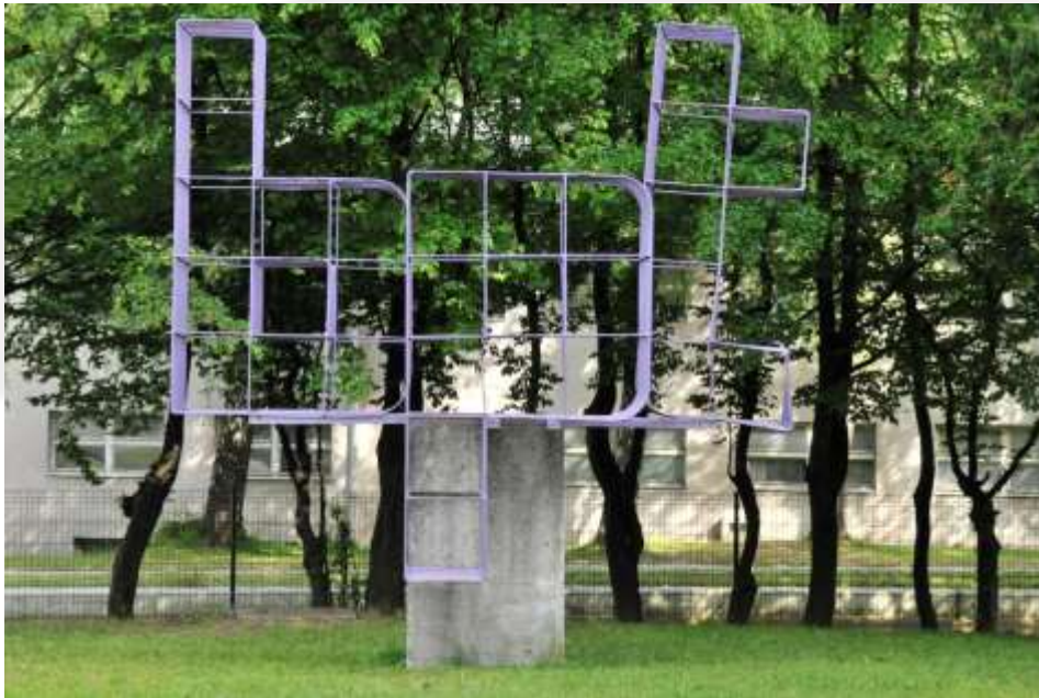
Znak: Vinko Tušek, akad kip. In slik