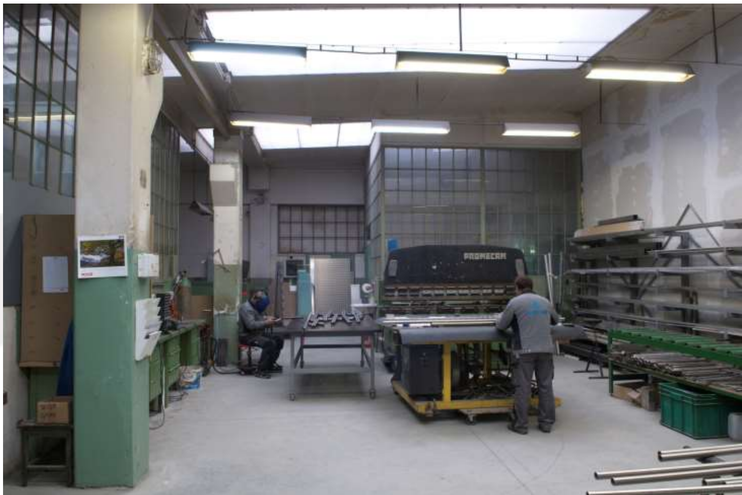
Kovinarska delavnica v delu stavbe