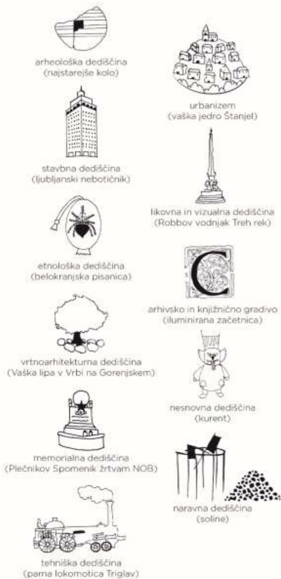
PODLAGA // vse zvrsti dediščine