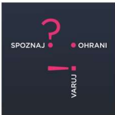
LOGOTIP // emotikon