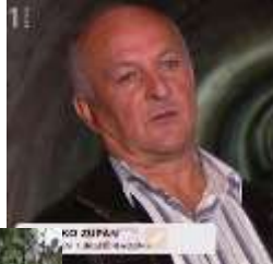
KO ŽUPAN KURATOR IZ OBLASTI KULTURNE PRAKSE

DEDIŠČINA #RAZVEDRILLO #UMETNOST DNEVNI KURATORJI KULTURNE DELO