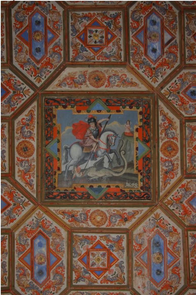
Lesen slikan strop z motivom sv. Jurija z zmajem danes krasi cerkev sv. Jožefa v Trziču