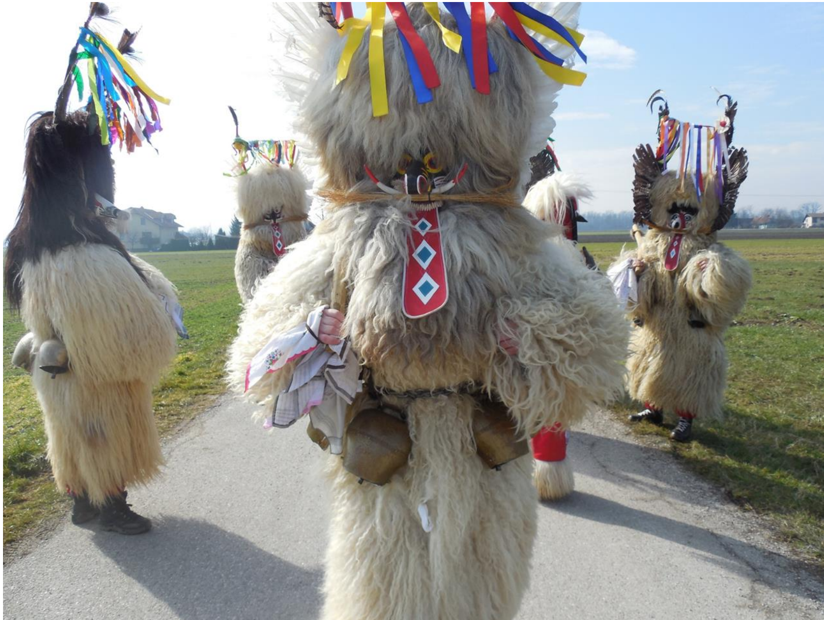
Ptujski korant (dokumentacija etnološkega oddelka Pokrajinskega muzeja Ptuj-Ormož)

https://ich.unesco.org/en/lists?text=&type=00002&multinational=3&display1=inscriptionID#tabs