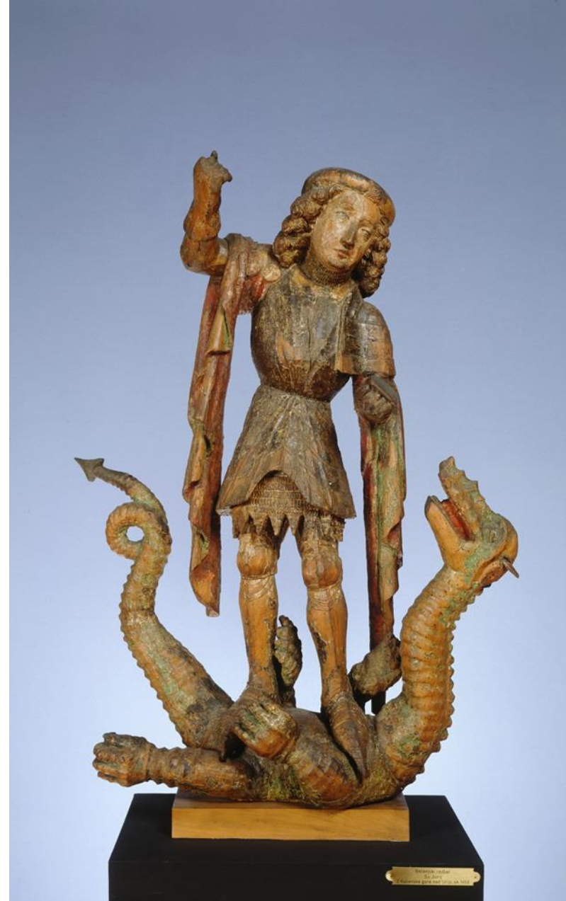
Sv. Jurij, ok. 1450, les, 82,5 x 60 x 24 cm z Gaberske gore nad Litijo sedaj NG