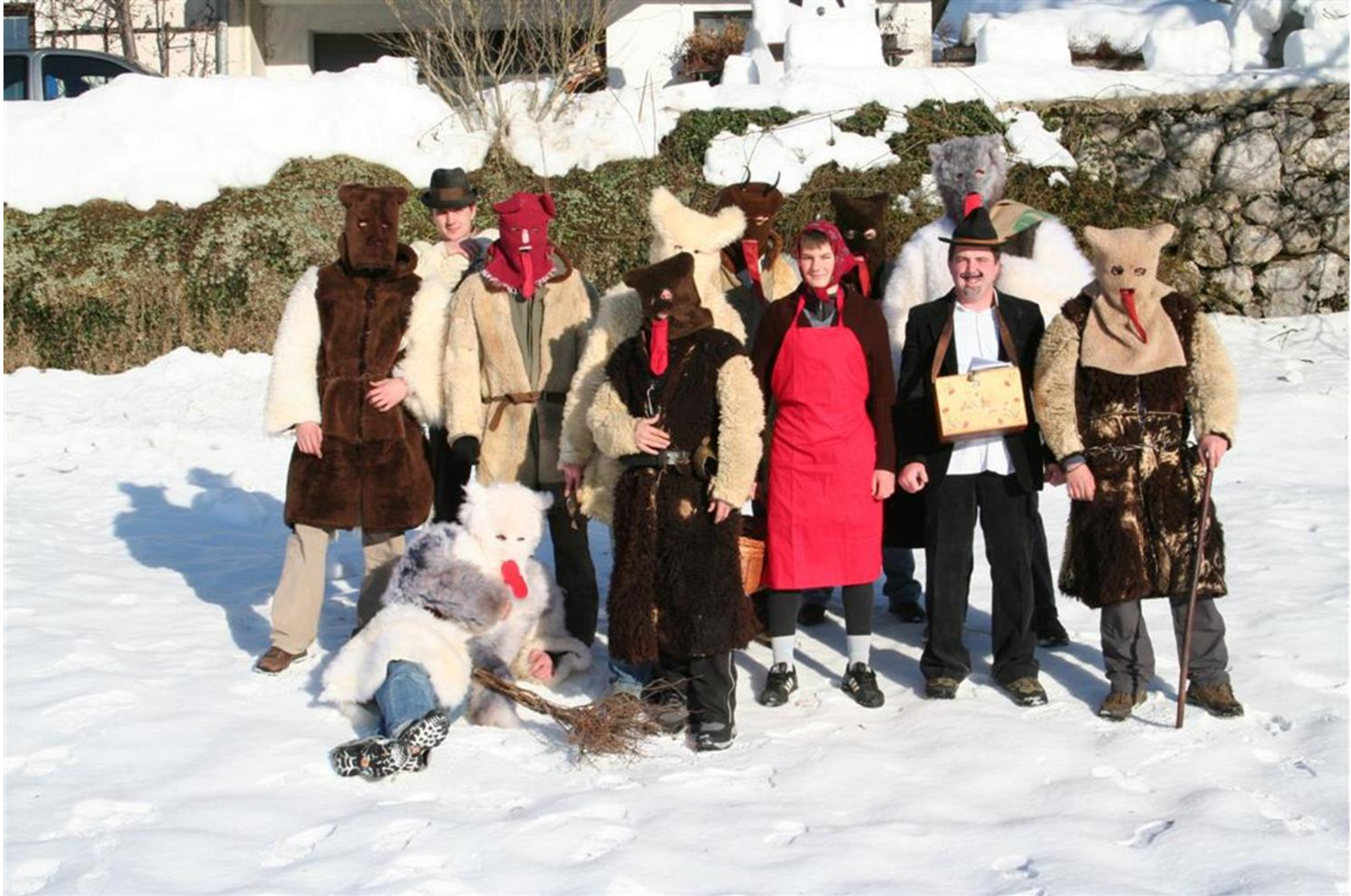
Bohinjski otepovci (dokumentacija Slovenskega etnografskega muzeja)

http://www.nesnovnadediscina.si/sl/register/otepanje-v-bohinju