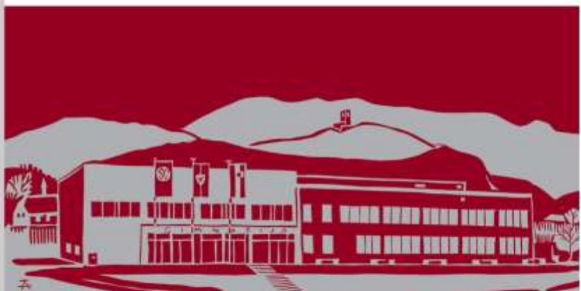
DEKD 2019 na Gimnaziji Slovenske Konjice