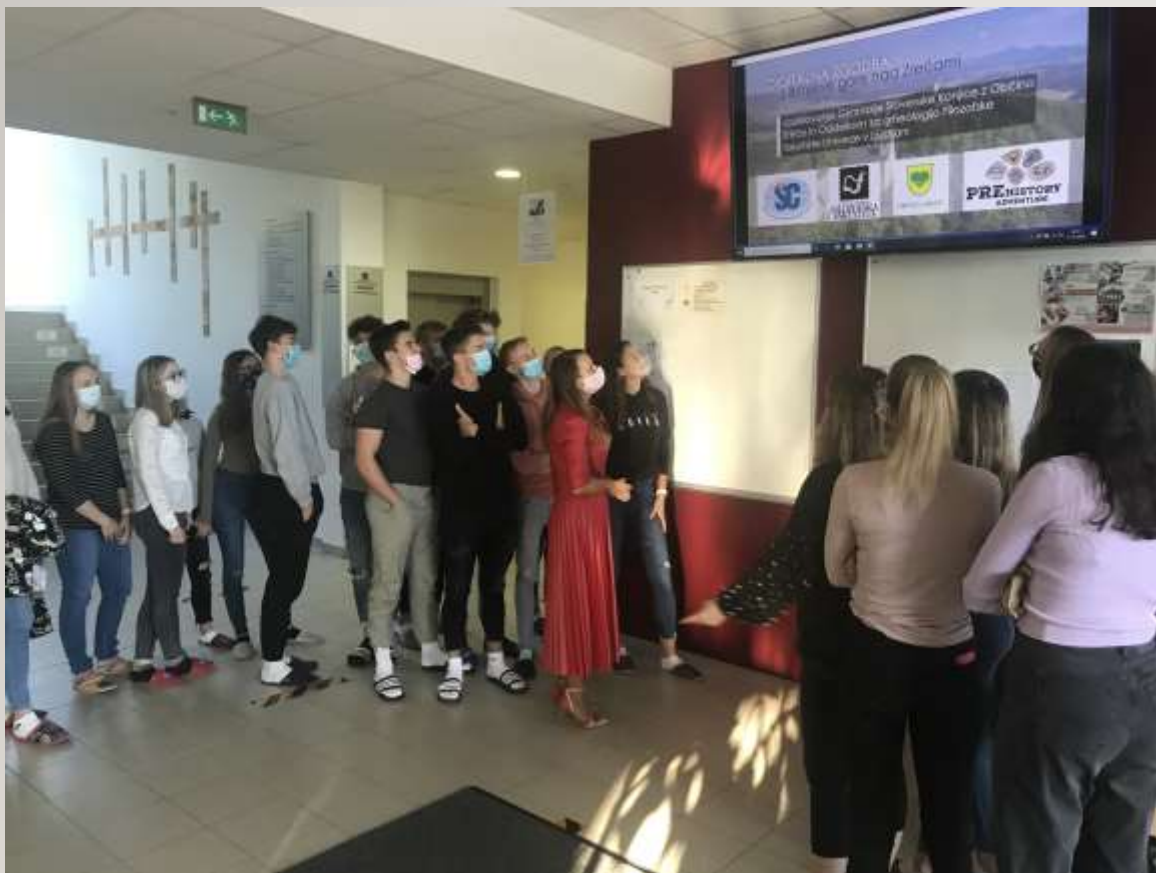
DEKD na Gimnaziji Slovenske Konjice, oktober 2021