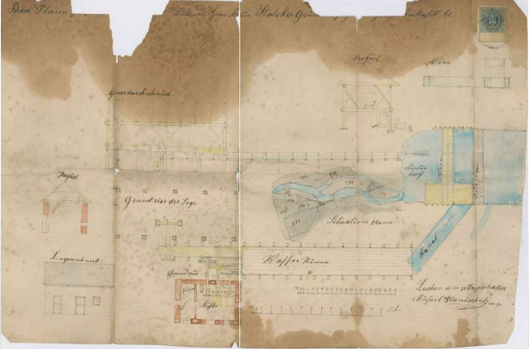
Žaga in mlin, načrt za gradnjo leta 1888.