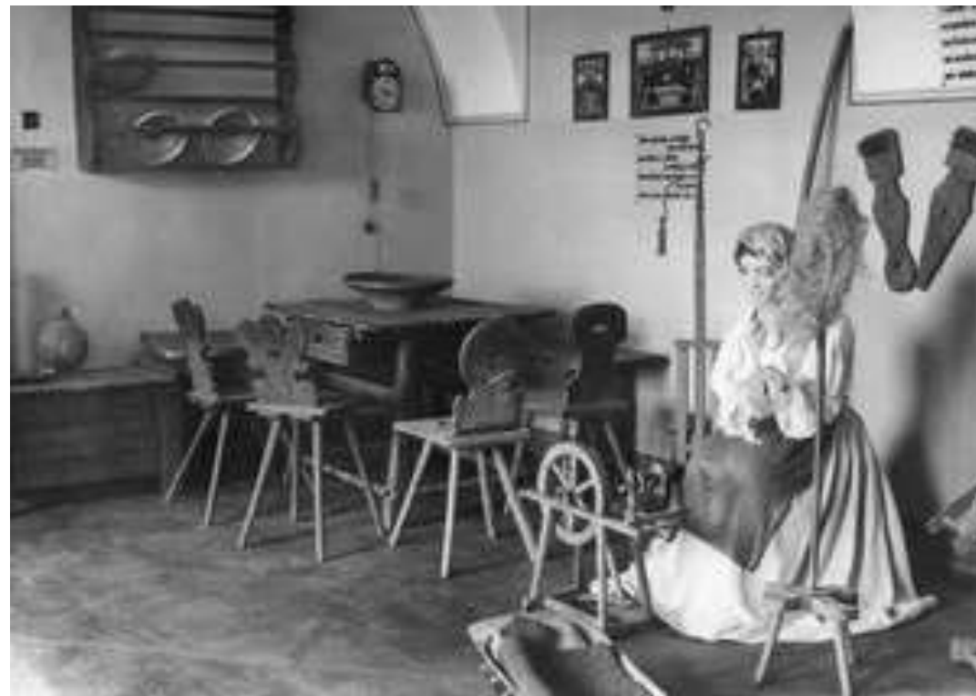
Prva stalna razstava.