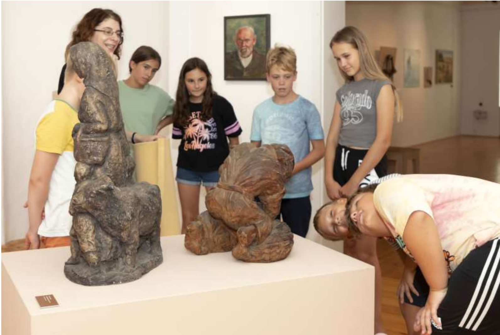
Muzejske delavnice v poletnih počitnicah, 2023.