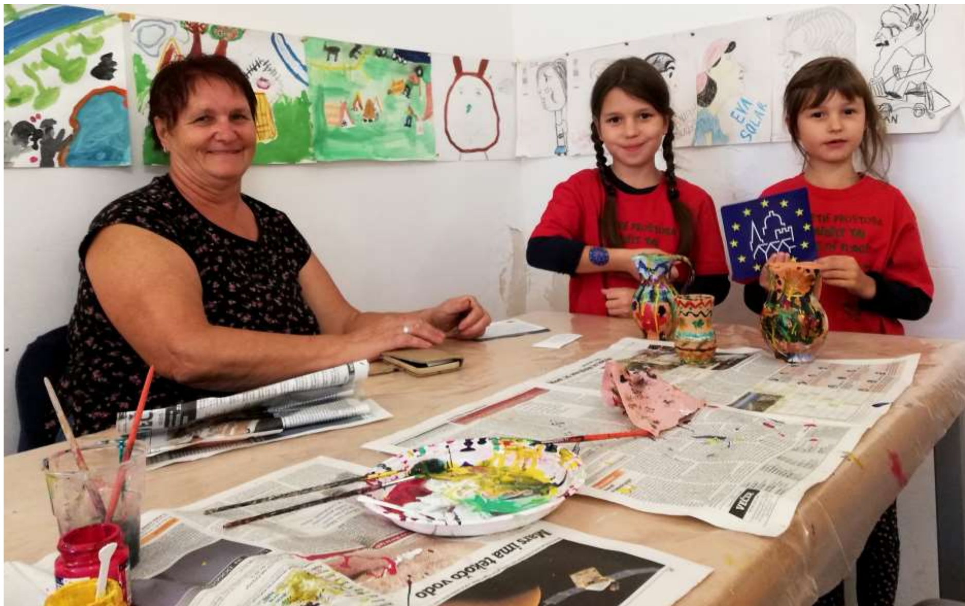
Brezplačna družinska delavnica v sklopu DEKD, 5. oktober 2019 (tema: trajnostna dediščina)