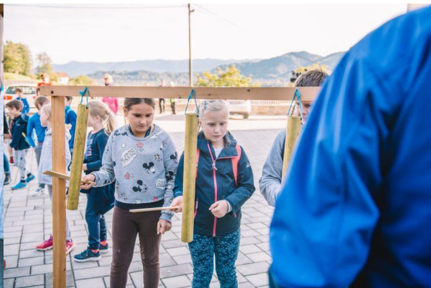
Pitrkovaška skupina Koroška Bela, pitrkovalci s Kamne Gorice, Farno kulturno društvo Koroška Bela, Župnija Koroška Bela