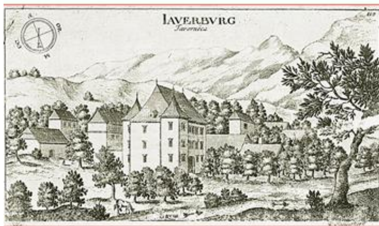
Najstarija znana upodobljena grafičinska jedra na Javorniku, Bukovca, Slava vzhodne Kranjske Vir: J. V. Valvasor, Slava vzhodne Kranjske, 1689