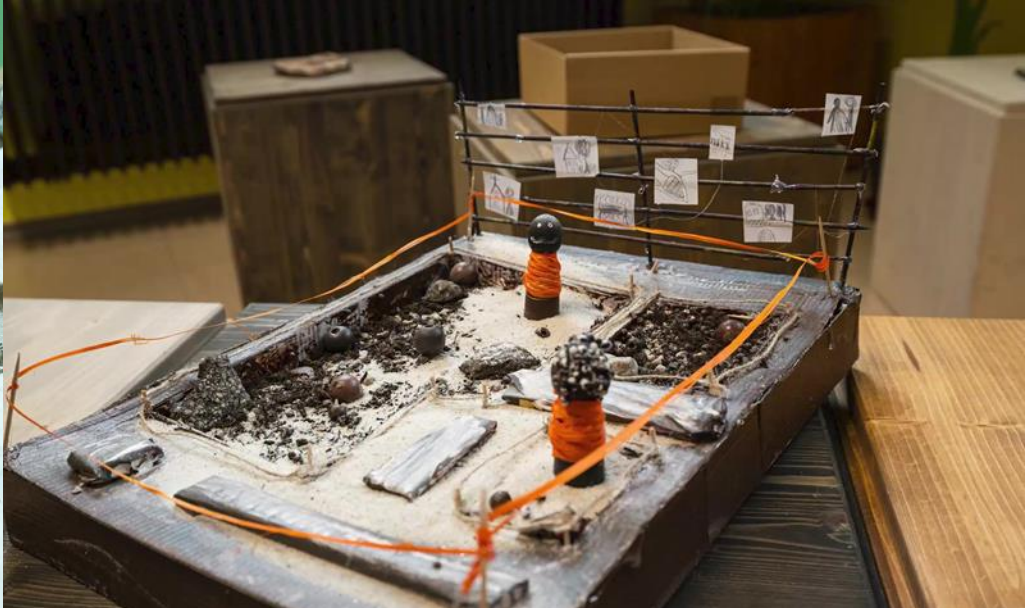
Izdelki učencev Osnovne šole Koroška Bela