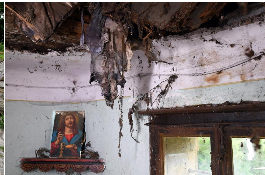
Fotograf Aleksander Novak Farno kulturno društvo Koroška Bela