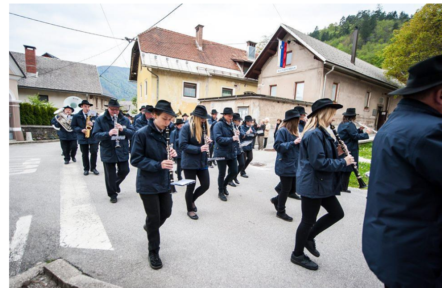
KD Pihalni orkester Jesenice – Kranjska Gora in JSKD