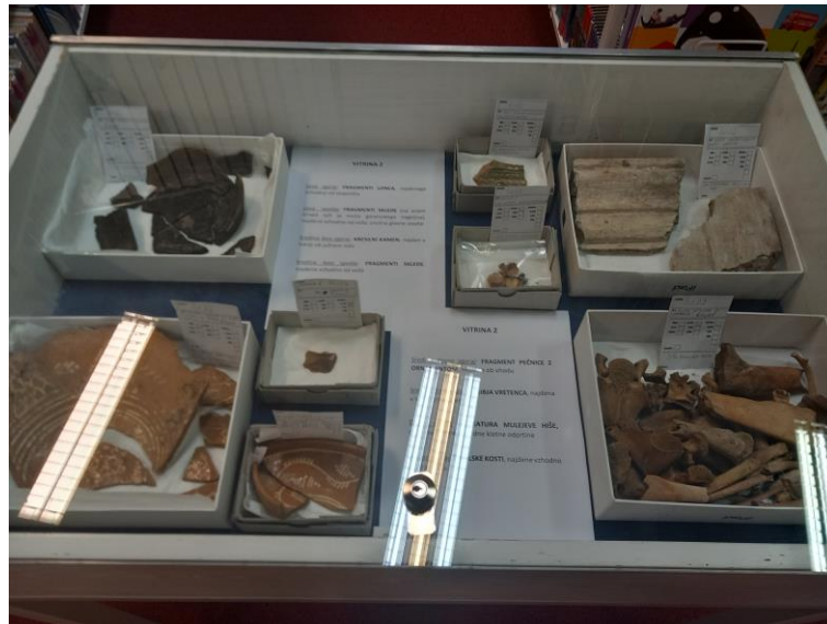
Občinska knjižnica Jesenice