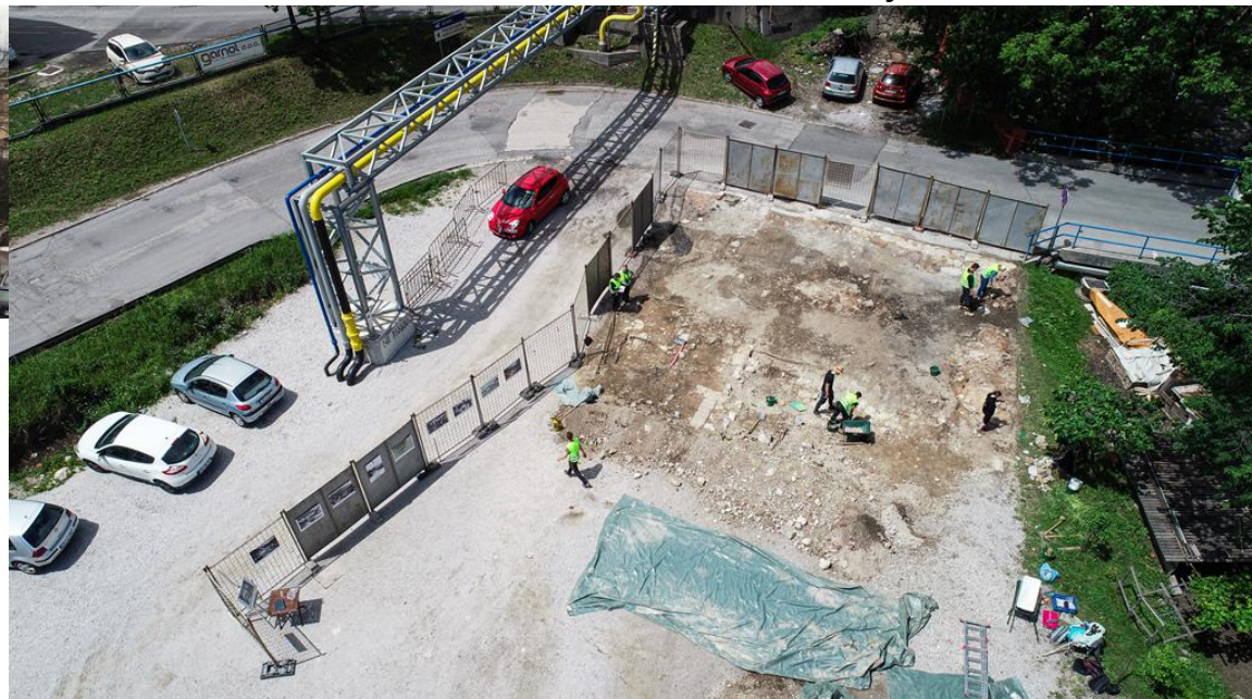
Arheološke raziskave temeljev Kosmačeve hiše na Javorniku 2022.

»Ime Javornik označuje prostor nekdanje vasi Jauerburg/Javornik, ki danes sodi po upravni razdelitvi v naselji Slovenski Javornik in Koroška Bela v občini Jesenice. Vas Jauerburg oz. Javornik se je izoblikovala na severni strani reke Save, tik ob obrežju pritoka Javornik. Sicer so podatki o naselitvi tega območja skozi zgodovino zaradi pomanjkanja raziskav ter skoraj popolne degradacije prostora nekdanje rudarsko železarske vasi zaradi intenzivne industrializacije zelo skopji. Vemo pa, da je bil ta prostor obiskovan že v prazgodovini in rimskem obdobju.«