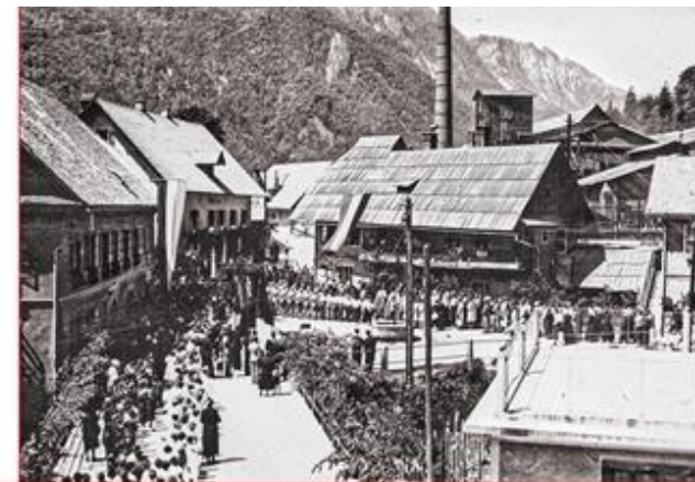
Vaiko jedra Javornik pred 2. svetovno vojno