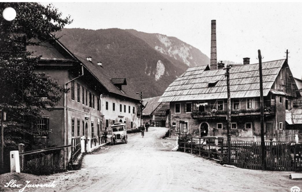
Javornik med leti 1928 – 1947. Zgoraj levo: Zoisov trg - lev s košaro.

Terensko delo študentov Oddelka za arheologijo Filozofske fakultete Univerze v Ljubljani na objektu in v delu trga historičnega prostora nekdanje vasi Javornik na Gorenjskem