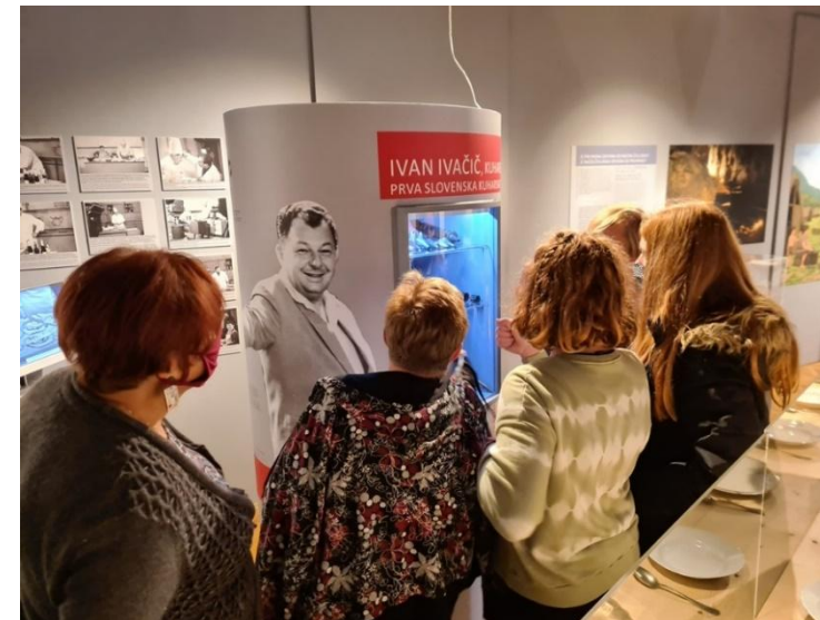
Javno vodstvo po razstavi Po Posavju z žlico in čašo - Pet čutov: 1-OKUS, 2. 10. 2021