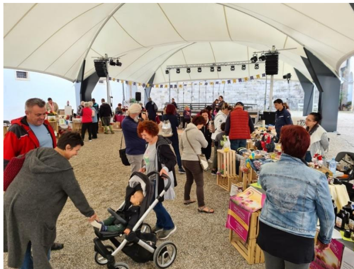
Sejem rokodelskih znanj in Grajska tržnica starin, 2. 10. 2021