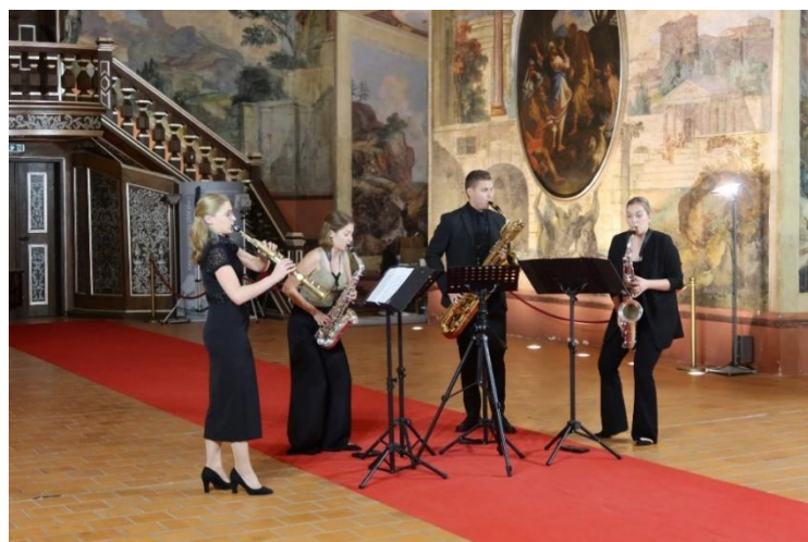
Koncert Kvarteta Eternum, 5. 10. 2022