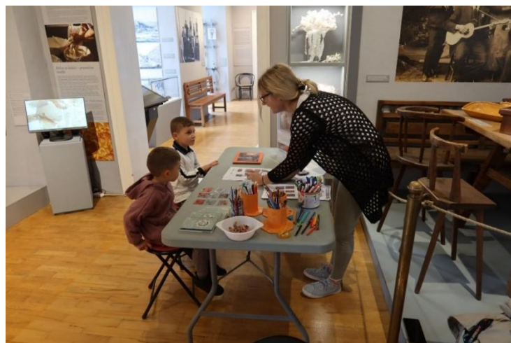
Družinska delavnica KRUH, POTICE IN KOLAČI, 8. 10. 2022

Tema DEKD je izhodišče, ne omejitev – pravo vrednost dogodkov ustvarijo ljudje, njihove zgodbe in povezave v prostoru.