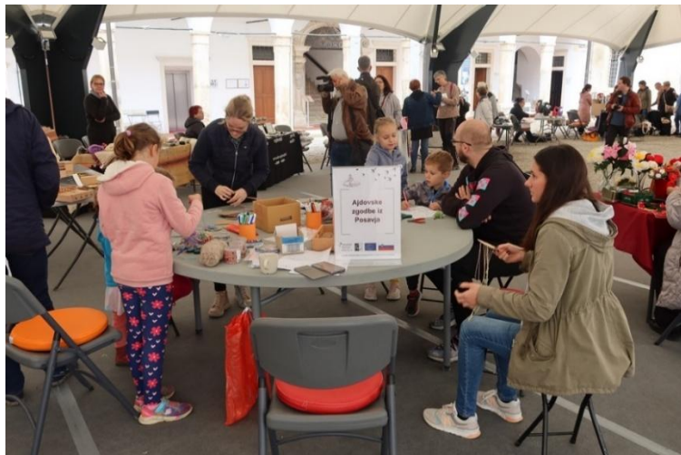
Sejem rokodelskih znanj in Grajska tržnica starin, 1. 10. 2022

- aktualna a abstraktna tema, zahteva veliko interpretacije in (vz)trajnosti