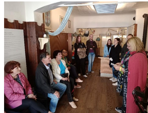
Vodstvo po brivsko-frizerskem salonu Kreutz, 30. 9. 2024