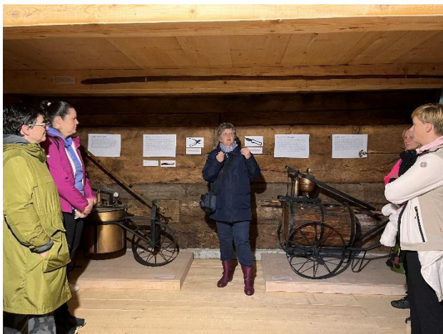
Vodstvo Banova domačija – okusimo dediščino, 28. 9. 2024