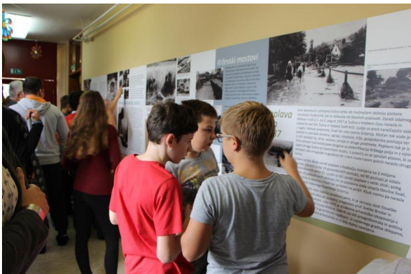
Odprtje prenovljene razstave na OŠ Podbočje Pod Bočjem sem doma, 27. 9. 2017