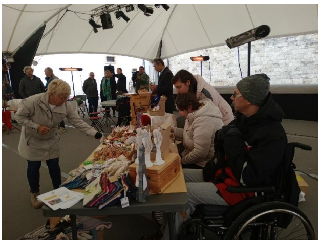
Sejem rokodelskih znanj in Grajska tržnica starin, 5. 10. 2024