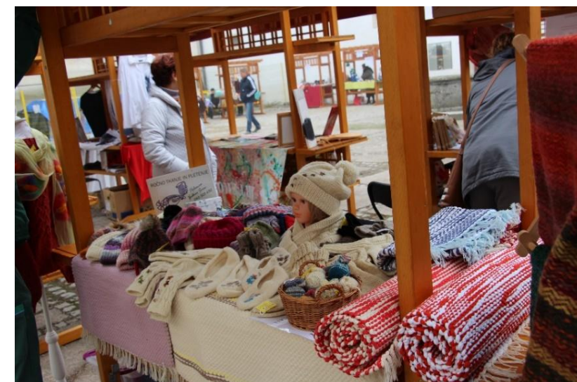
Sejem rokodelskih znanj in Grajska tržnica starin, 7. 10. 2017