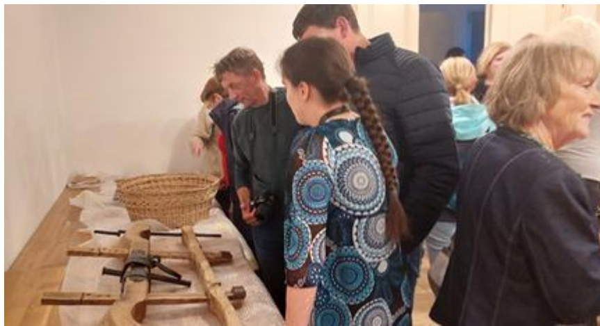
Skupnostna etnološka razstava Črneča vas, 29. 9. 2024