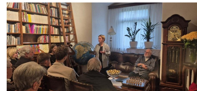
Tiskovna konferenca mreže Gradovi Posavja, 30. 9. 2025