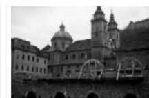
ARHITEKTURA IN URBANIZEM LJUBLJANE