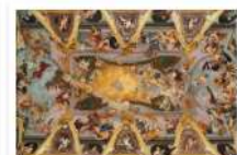
CERKVE IN VERSTVA