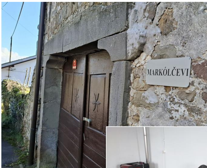
Projekt o hišnih imenih v KS Prem in KS Ostrožno Brdo v okviru participativnega proračuna