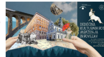
Plakat za Dneve evropske kulturne dediščine v Sloveniji