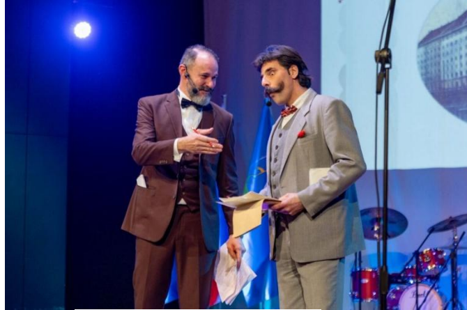
Kettejevo in Cankarjevo leto