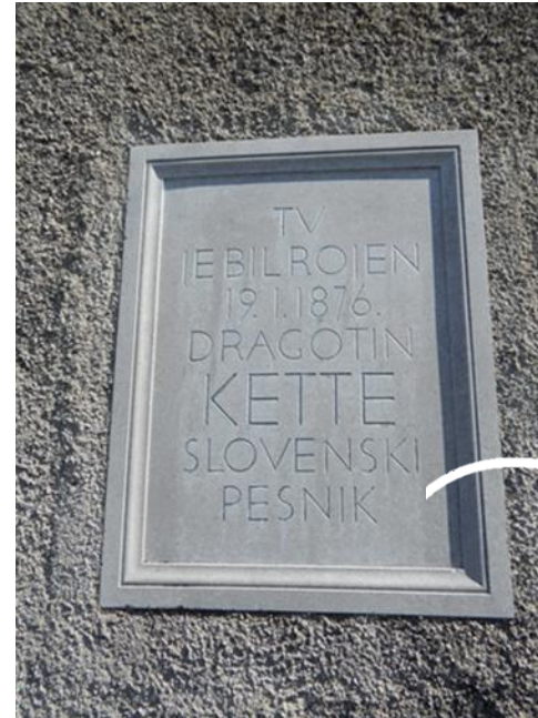
Obnova spominskih plošč v okviru PP