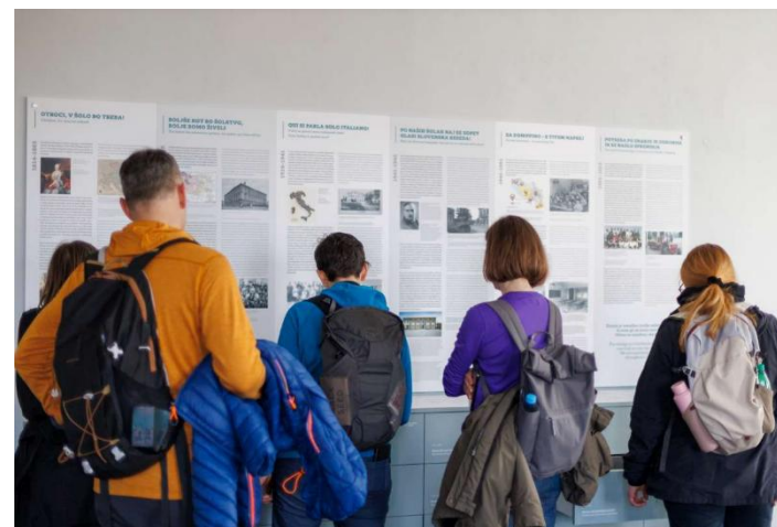
Šolski živžav, projekt Nprekinjenost sebe