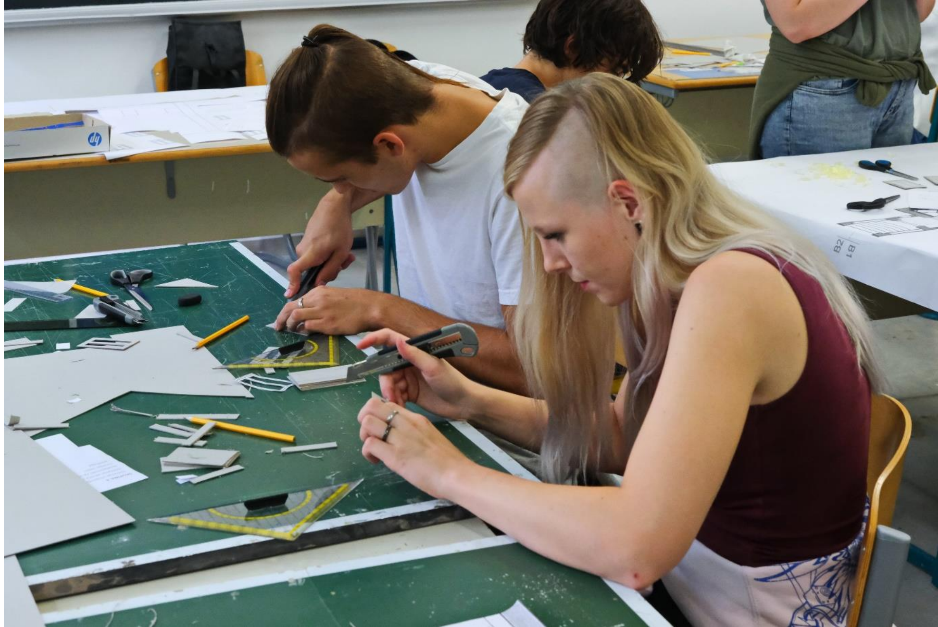
Izrezovanje delov makete