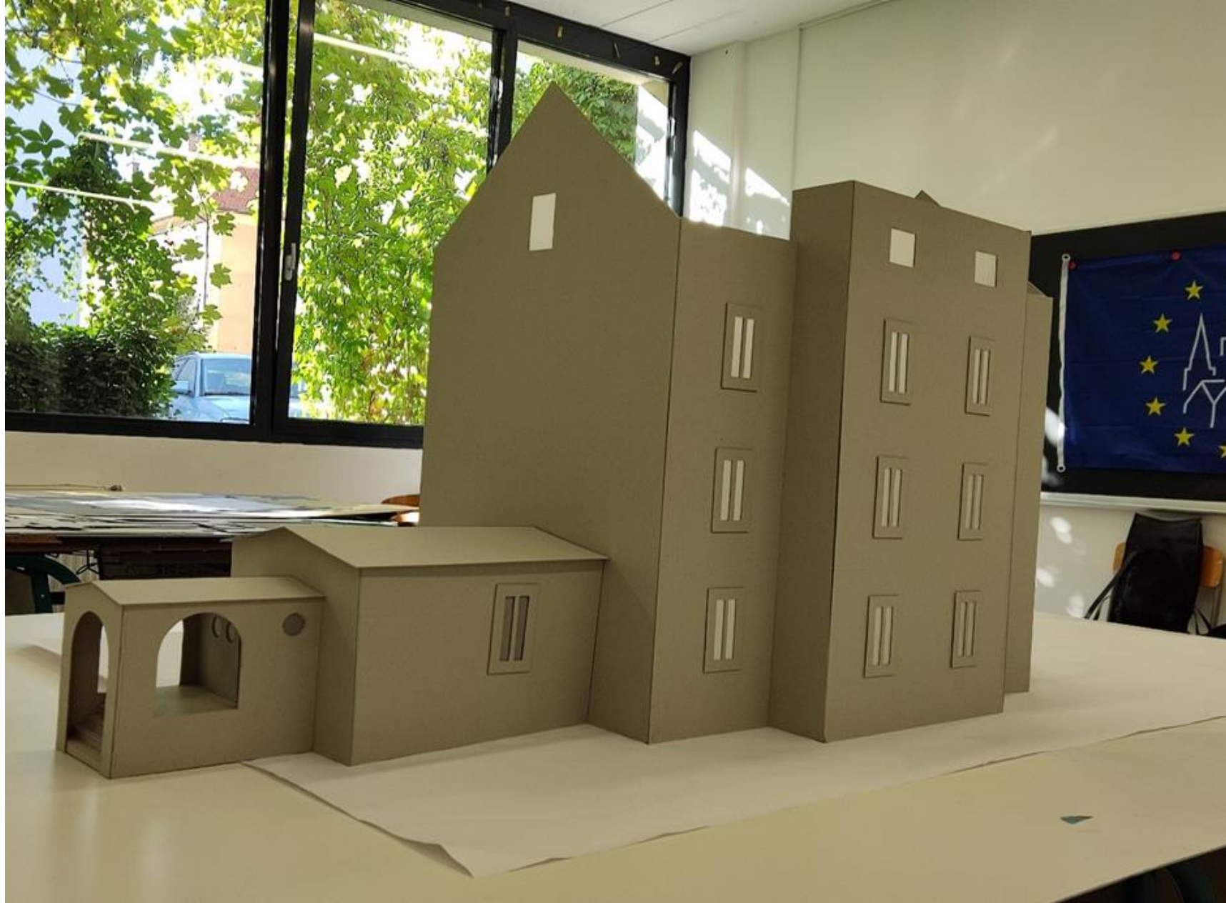
Sestavljanje makete stavbe.