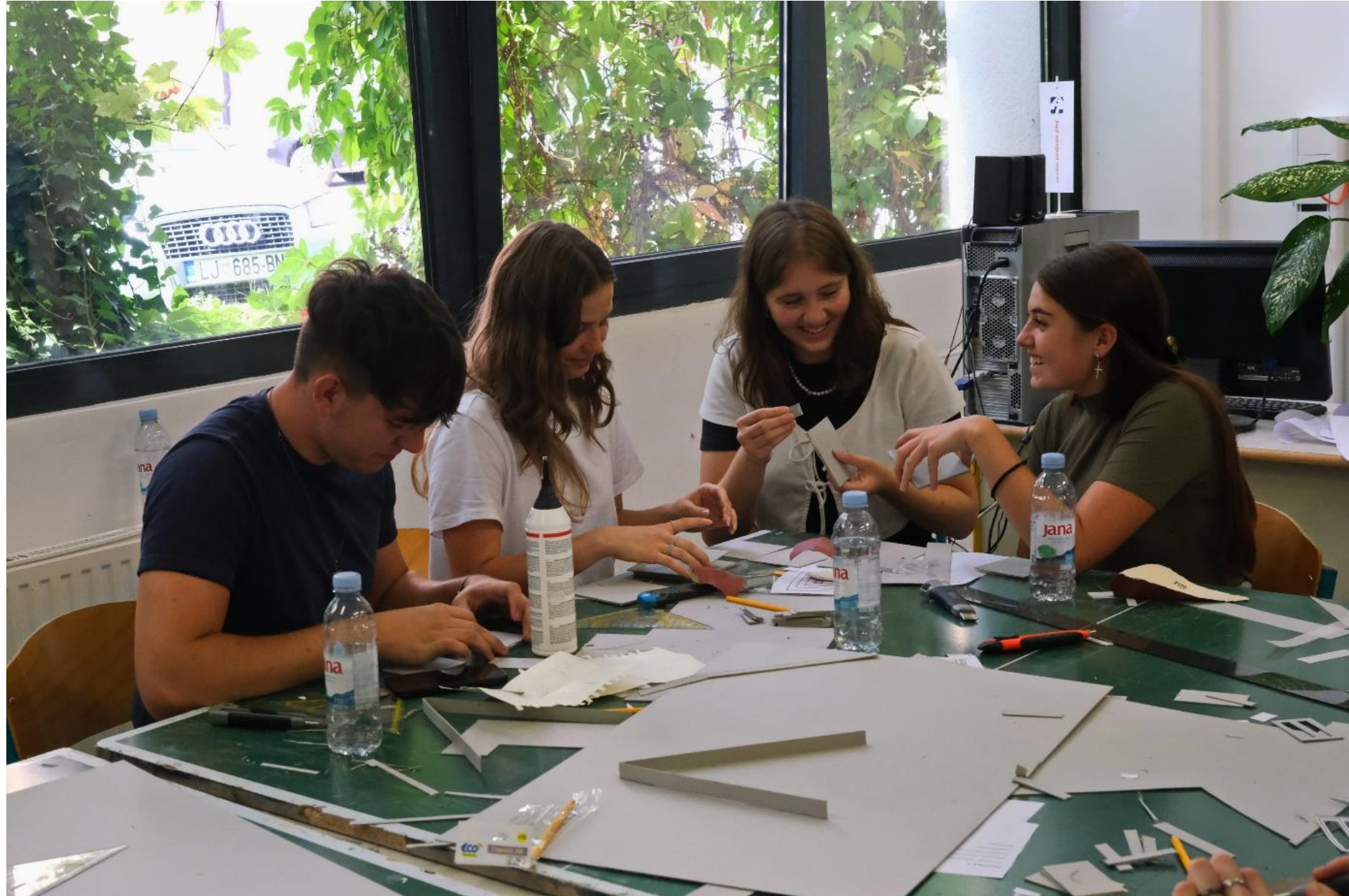
Lepljenje posameznih delov stavbe