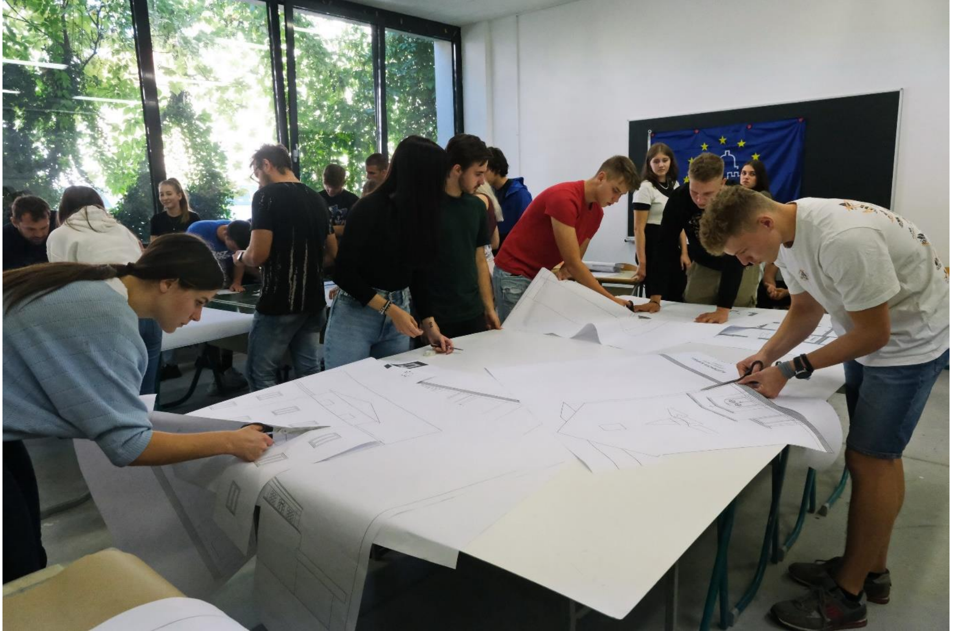
Izrezovanje načrta makete