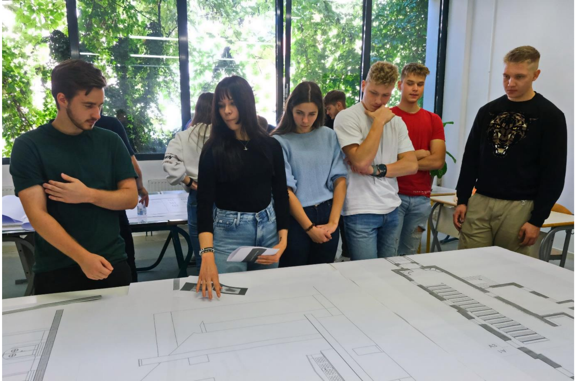
Začetek delavnice - napotki in priprave za izdelavo makete