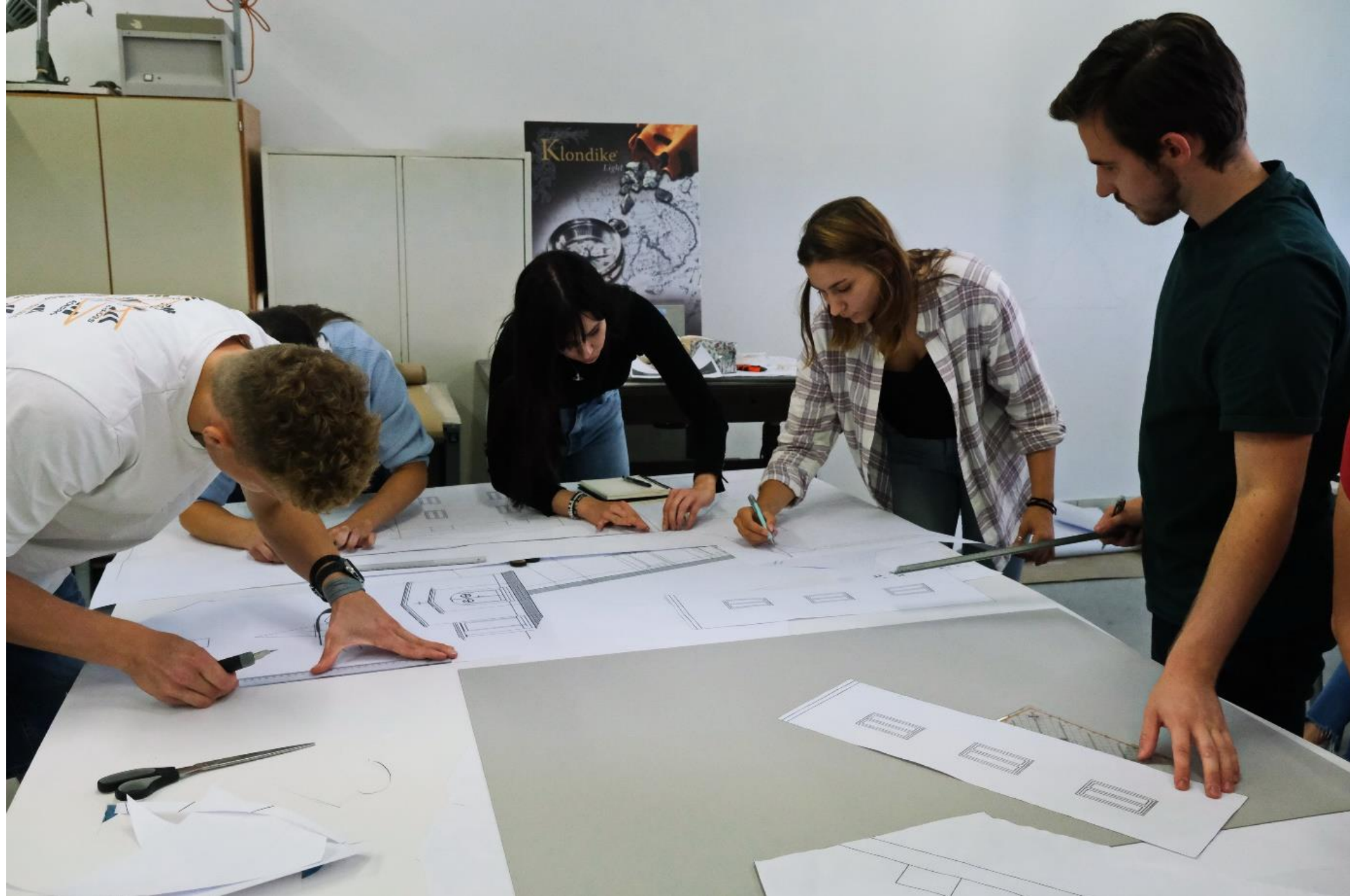
Izrisovanje in prenašanje detajlov na kartone