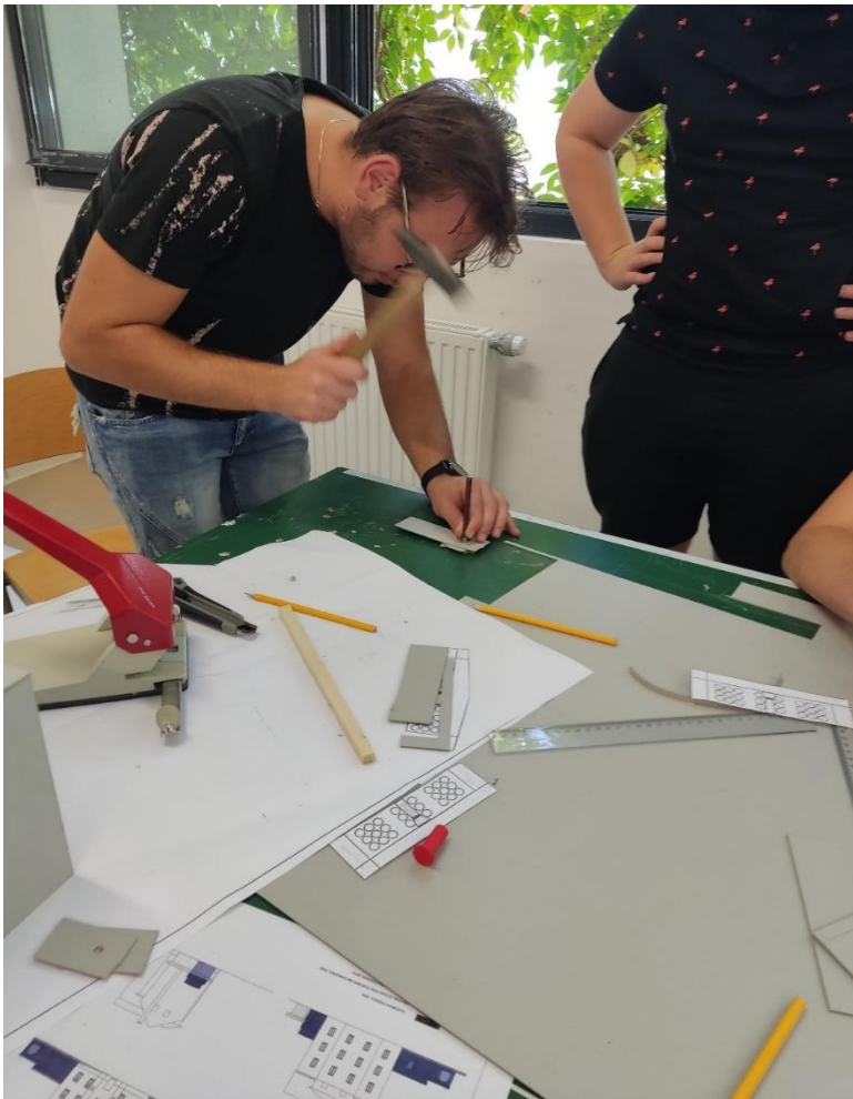
Izdelava podaljška kapele z notranjim prezbiterijem.