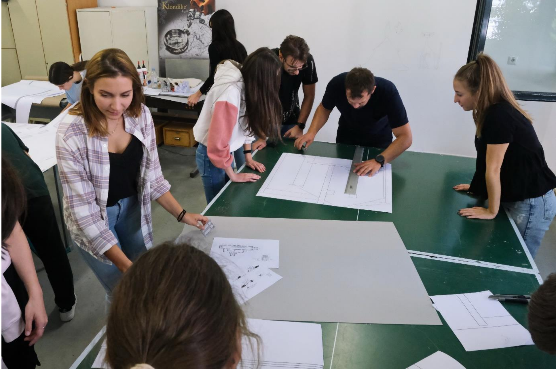
Prenašanje načrtov fasad na kartone.