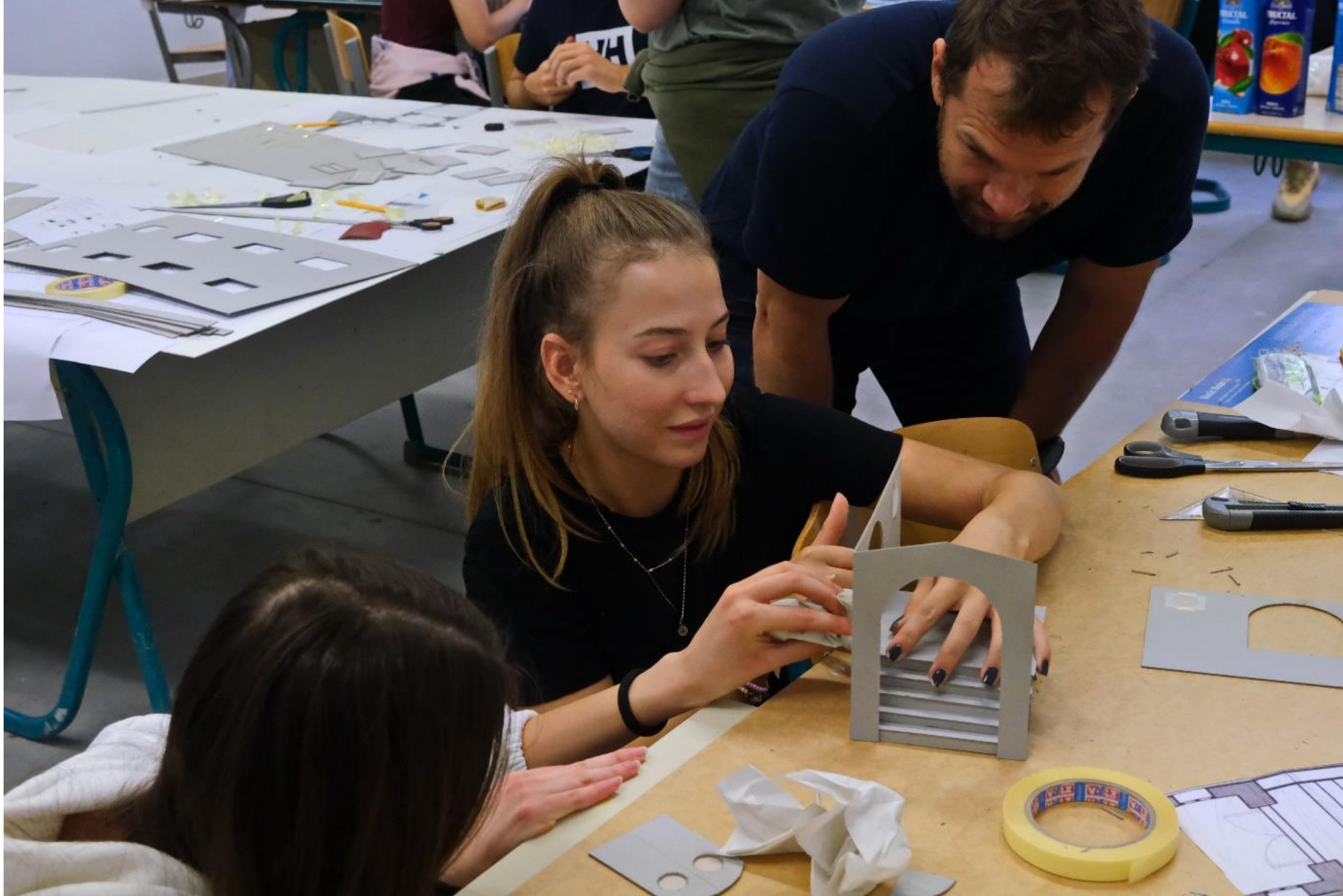
Sestavljanje detajlov makete – vhod s stopniščem in oboki.