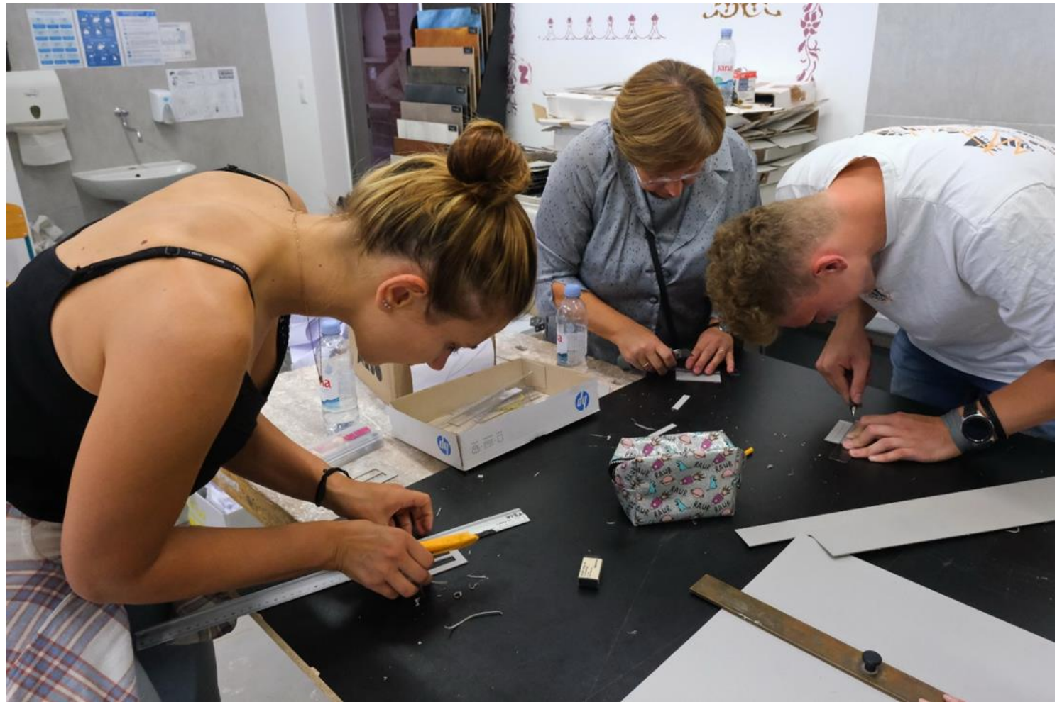
Izrezovanje oken fasade.